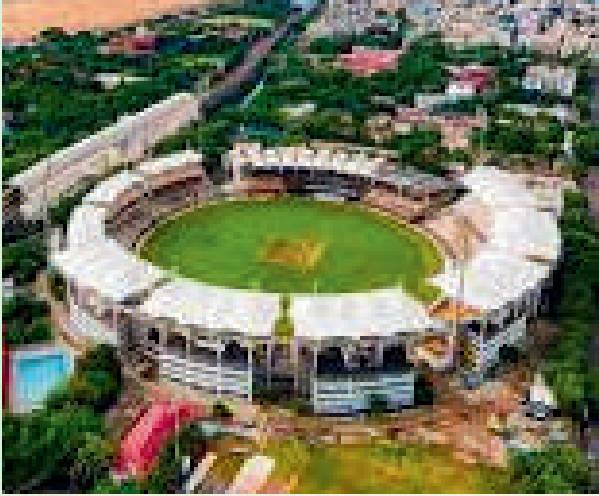
எம். ஏ. சிதம்பரம் மைதானம் சென்னை, தமிழ்நாடு

இந்த மைதானத்தில் நடந்த முதல் போட்டி 1792இல் நடந்ததாக வில்லியம் மற்றும் தாமஸ் டேனியேல் என்ற இரண்டு ஓவியர்களின் படைப்பில் தெரிய வருகிறது. 1846 இல் மெட்ராஸ் கிரிக்கெட் கிளப் தொடங்கப்பட்டு, போட்டிகள் நடைபெற்று வந்தது. ஆனால், அப்போது இங்கே இந்தியர்கள் விளையாட அனுமதியில்லாத சூழலும் நிலவியிருந்தது. அதற்கு காரணம், கிரிக்கெட் என்பது ஆங்கிலேயர்களின் ஆட்டமென்பதால், அவர்கள் மட்டுமே இங்கே விளையாட வேண்டும் என்ற ஆதிக்க எண்ணம் அவர்களுக்கு.