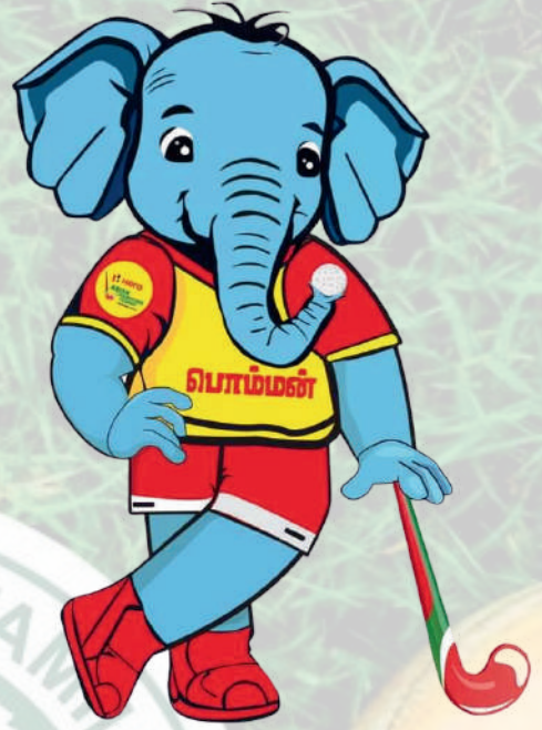
2023 ஆசிய ஹாக்கி சாம்பியன்ஷிப்பின் சின்னம்

ஆசிய ஹாக்கி போட்டிகள் சென்னையில் உள்ள மேயர் ராதாகிருஷ்ணன் மைதானத்தில் ஆகஸ்ட் மாதம் நடைபெற்றது. இதில் இந்தியா, மலேசியா, ஜப்பான், தென்கொரியா, சீனா மற்றும் பாகிஸ்தான் அணிகள் பங்கேற்று விளையாடின. பரபரப்பாக நடைபெற்ற லீக் சுற்றுகளின் முடிவில் இந்தியா, ஜப்பான், தென்கொரியா மற்றும் மலேசியா அணிகள் அரையிறுதிப் போட்டிக்கு முன்னேறின.